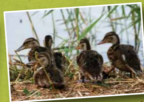
crías de ánade

Cabe destacar la presencia del Aguilucho cenizo ( Circus pygargus ), que utiliza la vegetación que rodea la laguna en este punto para nidificar, lo que ha contribuido a asignar la categoría de zona de protección integral de alto valor ecológico, dentro del Parque Natural.