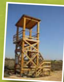
Torre de observación